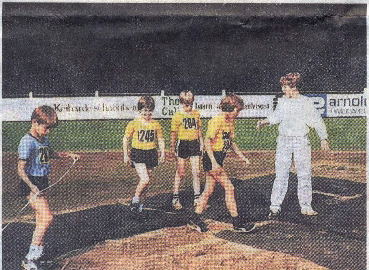
Verspringen voor de jeugd, rond 1980.