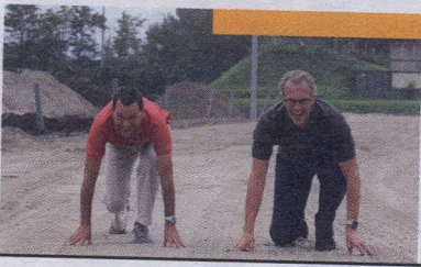
2 Baanse Atletiek Vereniging viert vijftigjarig bestaan met gevarieerde feestweek.